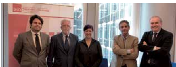
Encuentro de trabajo con la responsable de la Comisión de Presupuestos del Parlamento Europeo, Eider Gardiábal.