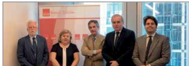
Reunión con la vicepresidenta de la Comisión de Agricultura del Parlamento Europeo, Clara Aguilera.