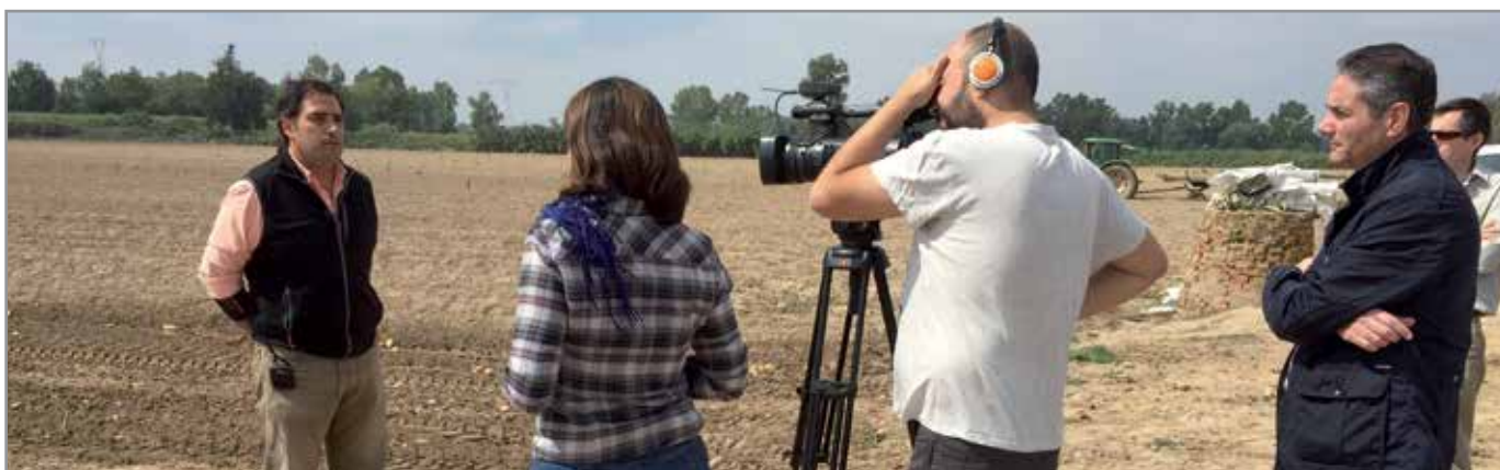
Grabación de un reportaje demostrativo de los objetivos del proyecto para Cuaderno Agrario TV.

En próximas fechas, se publicará un primer informe con los resultados de los ensayos de la presente campaña, que estará disponible para su consulta en la página web de ASAJA-Sevilla, www.asajasevilla.es .