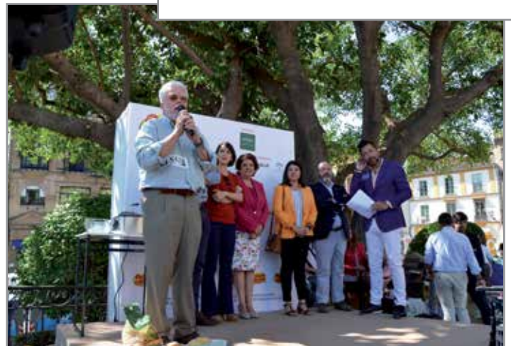
La emblemática plaza trianera del Altozano fue el lugar elegido para reivindicar el consumo de patata nueva de nuestra tierra.