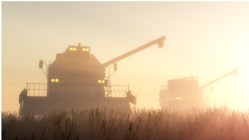
Proyecto ClimAgri contra los efectos del cambio climático