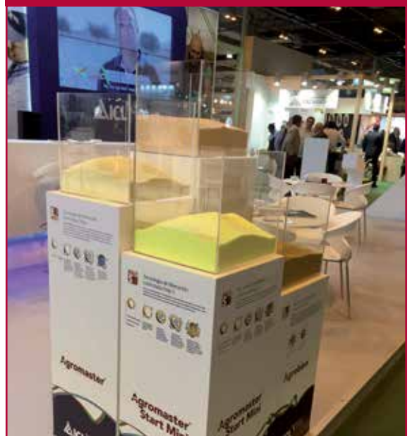
Nuevas tecnologías de nutrición precisa.

Para ampliar información visite la web www.icl-sf.com