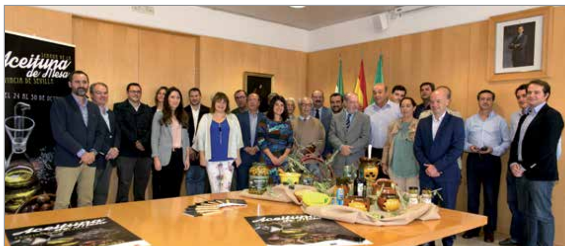
Presentación, en la Diputación de Sevilla, de la Semana de la Aceituna de Mesa.

Además, y en colaboración con la Asociación de Hoteles de Sevilla y Provincia, una veintena de hoteles repartieron distintas muestras de este producto a sus clientes , bien mediante el obsequio directo o mediante la degustación del mismo.