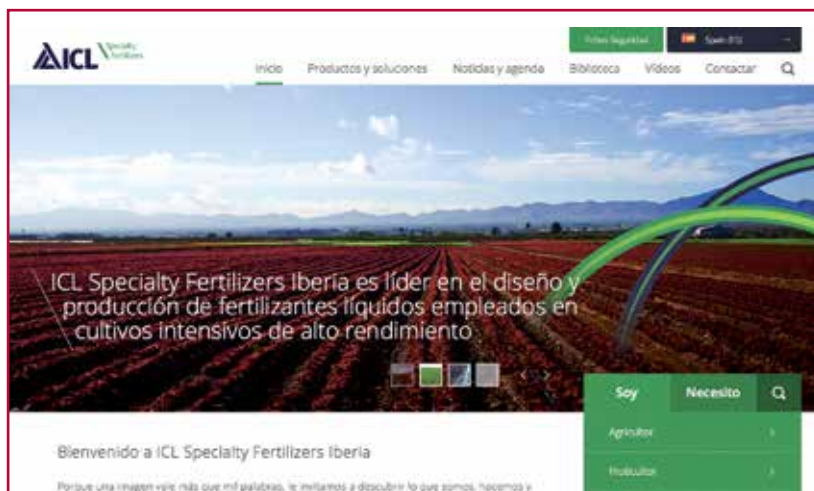
Nueva web de ICL Special Fertilizers en España.

Este video se puede ver en la nueva web www.icl-sf.es , que se ha presentado también en esta feria a través de iPads conectados a Internet, y que incorpora contenido de interés para los tres segmentos de mercado: agricultura, horticultura y áreas verdes. En la web encontramos contenidos técnicos específicos por cultivo e información detallada de productos, incluyendo fichas de seguridad. La web es muy dinámica y se actualiza continuamente con noticias y eventos para seguir el día a día de lo que sucede en ICL Specialty Fertilizers Iberia. También se pueden descargar los catálogos digitales.